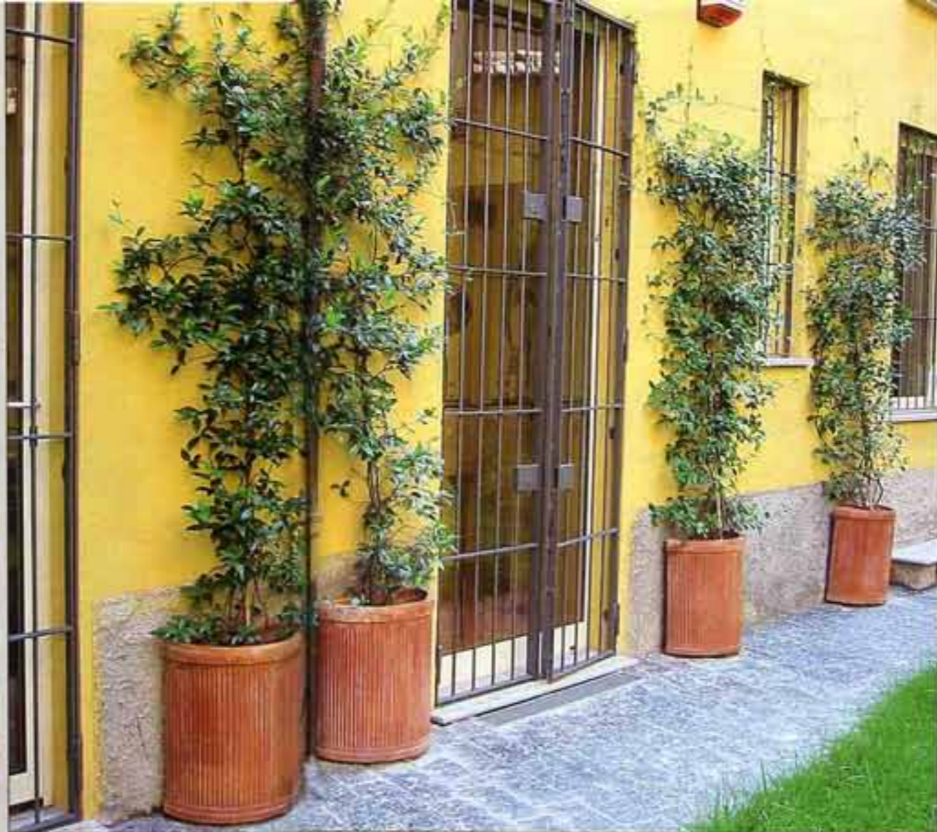
Mezzi vasi con falso gelsomino sono addossati alla parete con le finestre per fare entrare in casa la fragranza. Mentre un grande acero crea ombra alla zona pranzo.