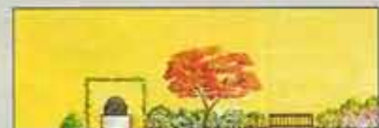
La parete con vasca di pietra e panca